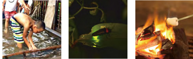
川魚とふれあいイベント ホタルウォッチング (車で約20~30分) 焼きマシュマロ体験