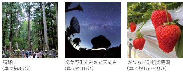
高野山 (車で約30分) 紀美野町立みさと天文台 (車で約15分) かつらぎ町観光農園 (車で約15~40分)